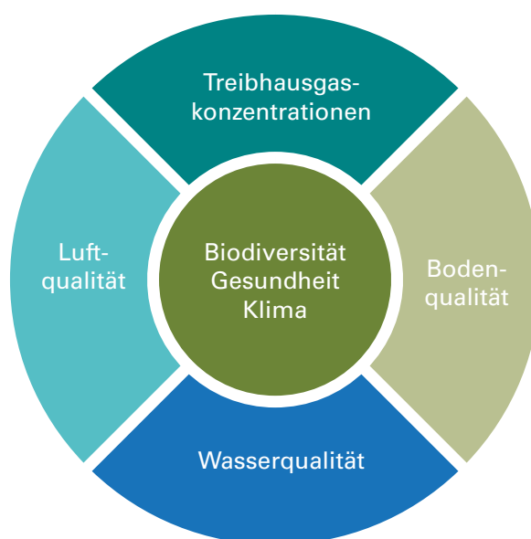
Abbildung 1: Vielfältige Belastungen durch Stickstoffverbindungen

Die Umweltbelastungen durch reaktive Stickstoffverbindungen spielen sich auf verschiedenen räumlichen Ebenen ab und interagieren teilweise