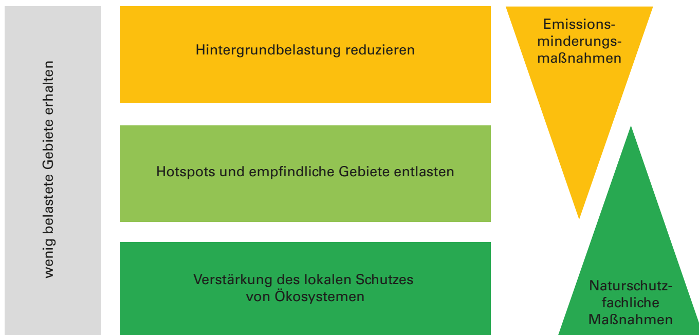
Abbildung 4: Vier einander ergänzende Ansätze zur Reduktion der Schäden von reaktiven Stickstoffverbindungen